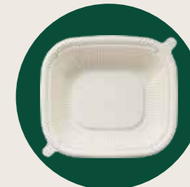
●シンプルで合わせやすい