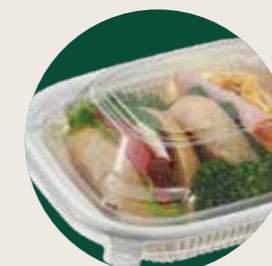
●中身の見える透明蓋